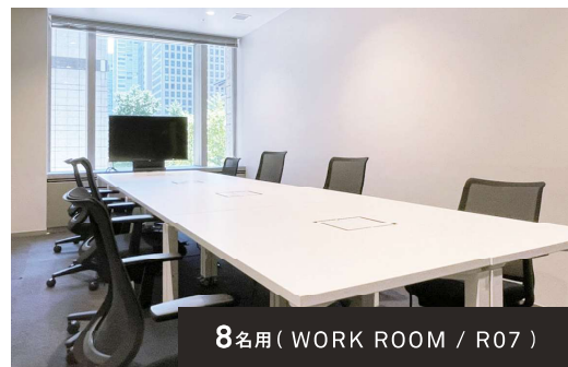
8名用 (WORK ROOM / R07)

集中してはたらかきたい時は自分たち専用のオフィスで、 ちょっとひと息つきたい時はホテルライクな ラウンジでコーヒーを飲みながら。 その時の気分にあわせて、自由なはたらき方を選択できる。 そんな場所がLIFORKです。 まずはお気軽にご見学ください。